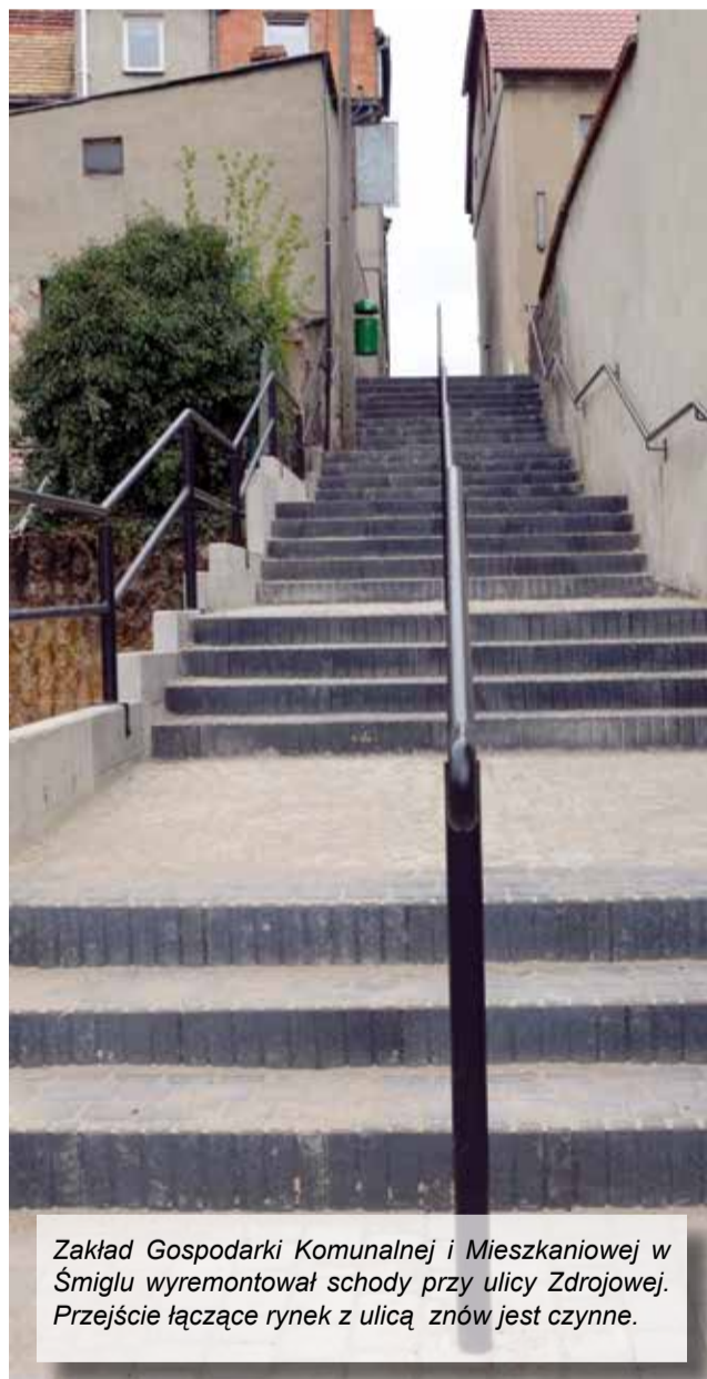
Zakład Gospodarki Komunalnej i Mieszkaniowej w Śmiglu wyremontował schody przy ulicy Zdrojowej. Przejście łączące rynek z ulicą znów jest czynne.

Szczegółowych informacji dotyczących zbiórki wiatraków można uzyskać w biurze promocji Urzędu Miejskiego Śmigla – tel. 65 5186 911. Zapytania i zgłoszenia prosimy kierować również na adres: promocja@smigiel.pl AKA