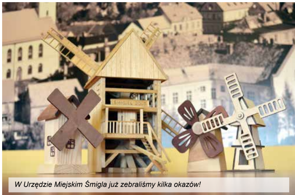
W Urzędzie Miejskim Śmigla już zebraliśmy kilka okazów!