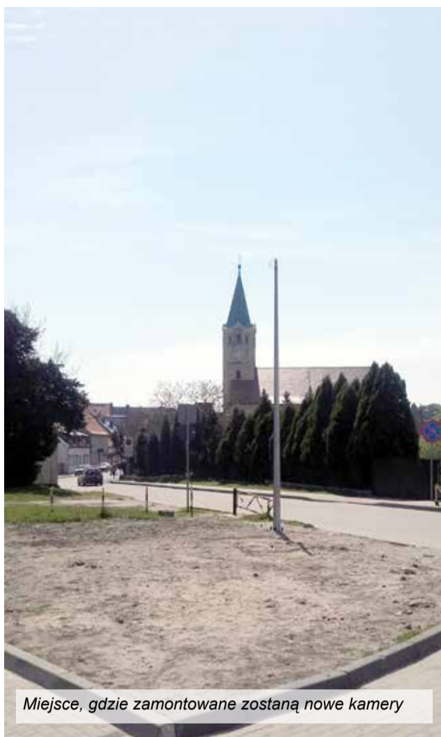
Miejsce, gdzie zamontowane zostaną nowe kamery