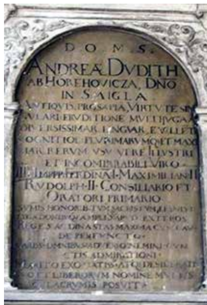
Epitafium Andrzeja Dudycza w kościele św. Elżbiety we Wrocławiu (w łacińskiej inskrypcji możemy przeczytać, że był właścicielem Śmigla)

A n d r z e j Dudycz (1533 – 1589) – właściciel Śmigla od 1583 roku. Był węgierskim szlachcicem pochodzenia chorwackiego, humanistą, dyplomata (ambasador cesarza Maksymiliana II), pisarzem, katolickim biskupem Kninu i Pécs, działaczem reformacyjnym braci