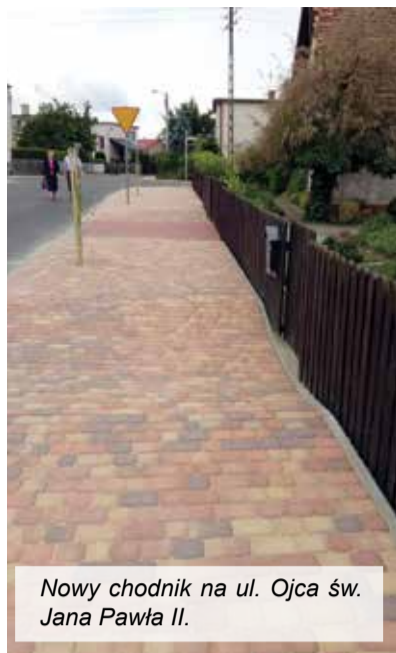
Nowy chodnik na ul. Ojca św. Jana Pawła II.