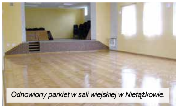
Odnowiony parkiet w sali wiejskiej w Nietążkowie.