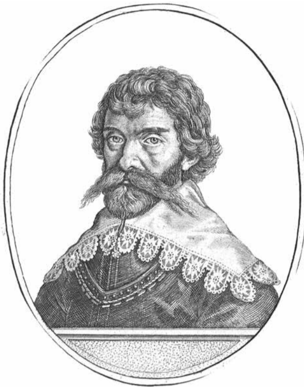
Krzysztof Arciszewski – rycina z XVII w.

G dyby miała powstać hollywoodzka superprodukcja filmowa o życiu jakiegoś Polaka, to z całą pewnością Krzysztof Arciszewski mógłby otrzymać nominację. Jego burzliwe życie to wszak gotowy, filmowy scenariusz.