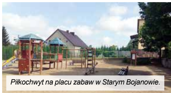
Piłkochwyty na placu zabaw w Starym Bojanowie.