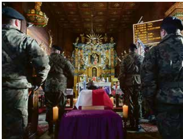
ralne, Sołectwo Bronikowo, Bronikowo. AKA, fot. AJ KGW w Bronikowie i OSP

Po mszy świętej oraz uroczystości na cmentarzu w sali wiejskiej odbyło się przedstawienie w wykonaniu uczniów Szkoły Podstawowej w Bronikowie połączone z poczęstunkiem. W przygotowanie grudniowej uroczystości zaangażowali się: Burmistrz Śmigła, Szkoła Podstawowa im. por. Stefana Rysmanna w Bronikowie, Instytut Pamięci Narodowej, Parafia pw. św. Franciszka z Asyżu w Bronikowie, Śmigiełskie Towarzystwo Kultu-