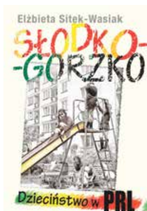
„Słodko-gorzko. Dzieciństwo w PRL” – Elżbieta Sitek-Wasiak

Na wakacyjne dni Miejska Biblioteka Publiczna w Śmiglu poleca książkę „Słodko-gorzko. Dzieciństwo w PRL” opartą na wspomnieniach osób urodzonych i wychowanych w różnych deka-