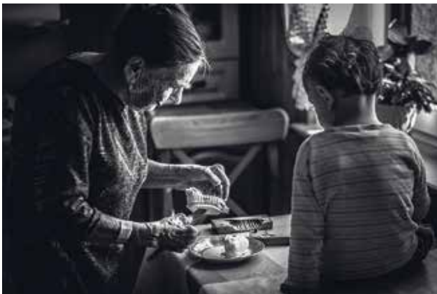
„Z pokolenia na pokolenie”. Praca zdobyła III nagrodę w XII Ogólnopolskim Biennale Fotografii „Kochać człowieka”.