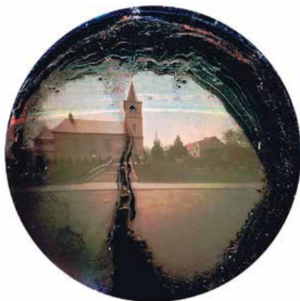
fotografia wykonana techniką solarigrafii. Praca zdobyła najwyższy laur w XL Ogólnopolskim Konkursie Literacko-Fotograficzno-Plastycznym Konfrontacje

Swoje prace fotograficzne konfrontują z osiągnięciami innych. Efektem są liczne nagrody i wyróżnienia za fotografie w konkursach fotograficznych o zasięgu krajowym. W roku 2021 najaktywniejszym członkiem grupy był Piotr Szudra, który został zaproszony do udziału w IX Brzeskim Festiwalu Fotografii Otworowej. W wystawie pokonkursowej OFFO 2021, zaprezentowano 12 fotografii Piotra. Kolejnym sukcesem był najwyższy laur, pierwsza nagroda w ramach